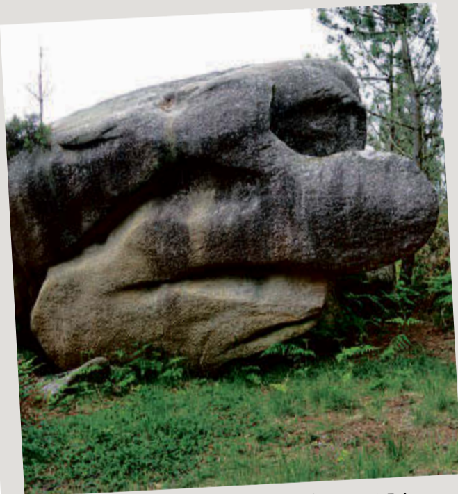
‘O paiaso triste’, un dos singulares penedos.

Pérez Alberti ten claro que este singular conxunto granítico “é único” pois ningún “ten tanta riqueza xeomorfolóxica como os Penedos de Traba e Pasarela, nos que a natureza modelou animais, persoas e outras formas xeométricas sen que teñamos constancia de que existan e ningún outro sitio”, afirmou.