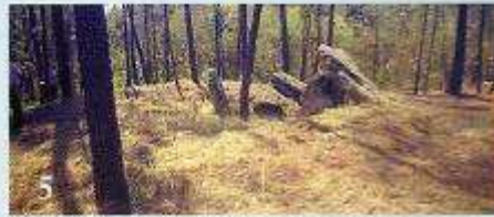
5 Pedra Moura de Pedra Vixia (Lamas-Zas)