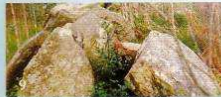
9 Pedra da Lebre (Serramo-Vimianzo)