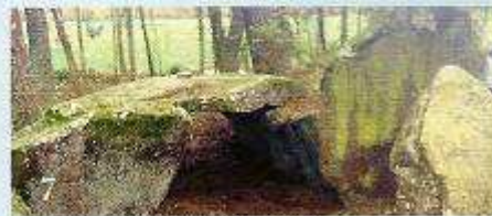
7 Pedra Cuberta (Treos-Vimianzo)