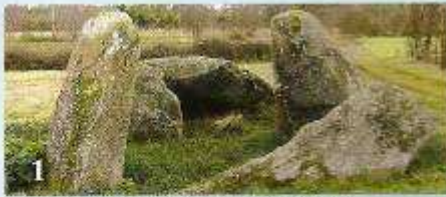
1 Pedra Moura de Aldemunde (Carballo)