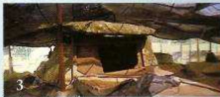
3 Dolmen de Dombate (Borneiro-Cabana)