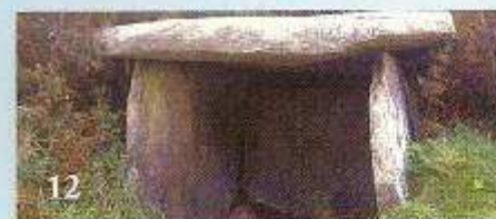
12 Casota de Freán (Berdoías-Vimianzo)