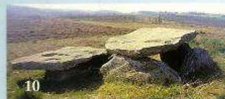
10 Arca da Piosa (Muíño-Zas)