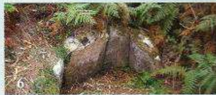
6 Mina de Becesindes (Carantoña-Vimianzo)