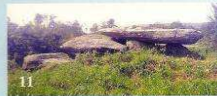
11 Pedra da Arca (Regoelle-Dumbria, Baiñas-Vimianzo)