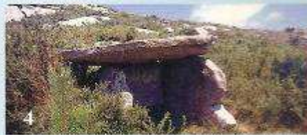
4 A Fornela dos Mouros (O Aplazaduiro, Nande-Laxe)