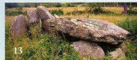
13 A Mina da Parxubeira (Corveira, Eirón-Mazaricos)