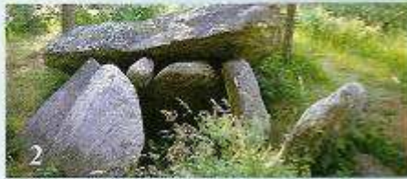
2 Pedra da Arca (Cerqueda-Malpica)