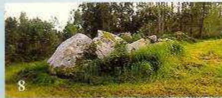
8 Pedra Moura de Carnio (Treos-Vimianzo)