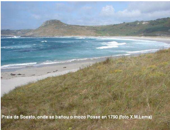
Praia de Soesto, onde se bañou o mozo Posse en 1790

Polo que nos conta na súa autobiografía, Posse pasou a súa infancia no seu Soesto natal