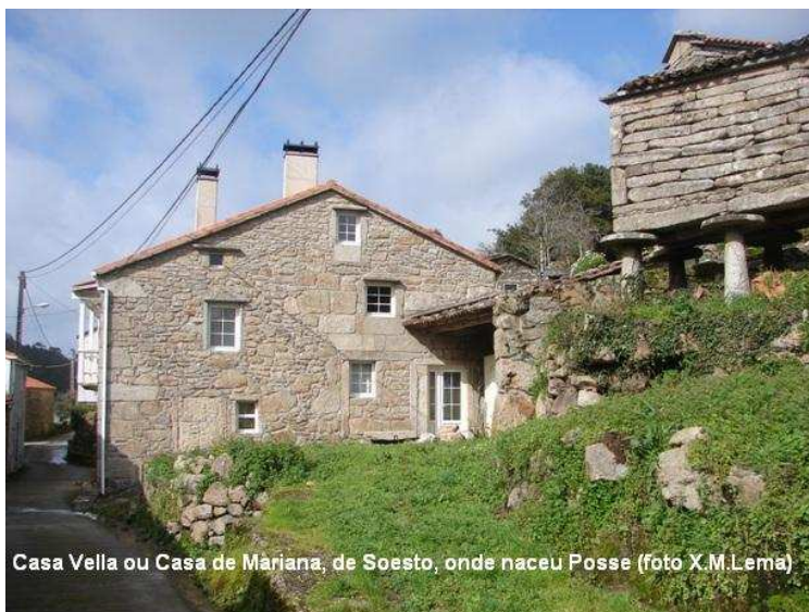
Casa Vella ou Casa de Mariana, de Soesto, onde naceu Posse

Finalmente, en 1995, once anos despois de que R. Herr publicara as memorias de Posse, a familia que actualmente vive na Casa Vella ou de Mariana de Soesto achou un opúsculo