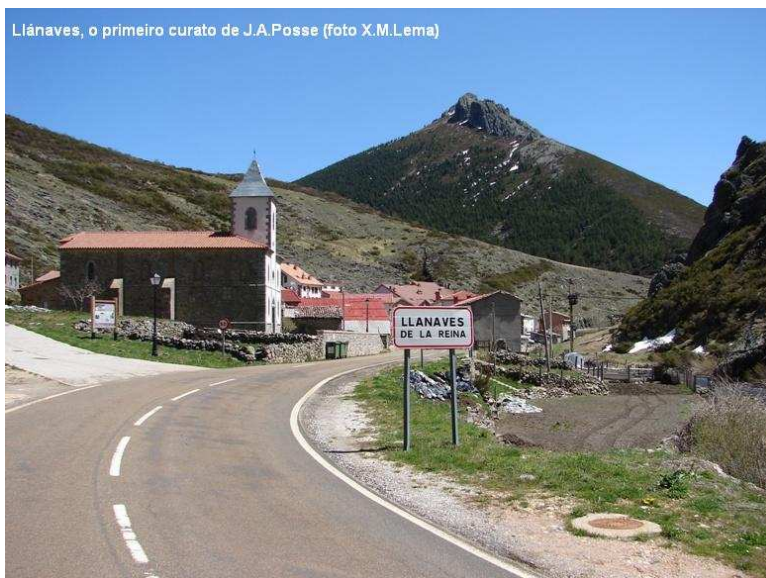
Llánaves, o primeiro curato de J.A.Posse

O seu progresismo no eido político e social parece transformarse, non obstante, en conservadorismo en materia relixiosa, pois volve defender a presenza da relixión no texto constitucional como xa o fixera en 1812. Pero, como xa adiantamos, esta súa relixiosidade dista moito das posturas reaccionarias, pois xa en 1812 fixera unha condena expresa da intolerancia e do despotismo relixioso e, por ende, da Inquisición (“Nunca fue más pura la Fe... que en los primeros siglos de la Iglesia, cuando no había inquisición”, [Posse/apud Herr 1984: 268]). Seguía bebendo, polo tanto, nas fontes xansenistas do séc. XVII, que tamén propugnaban a volta á pureza dos primeiros tempos do cristianismo como remedio á corrupción da xerarquía eclesiástica.