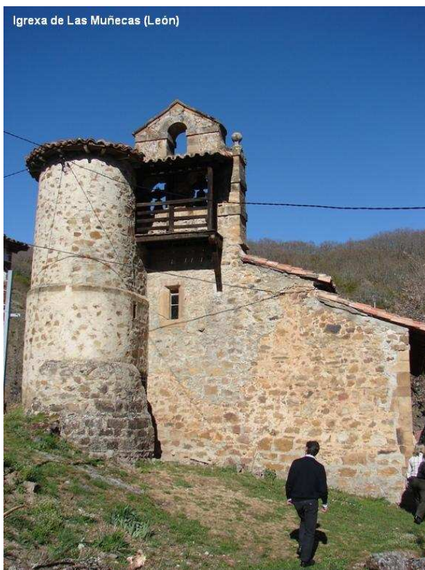
Igrexa de Las Muñecas (León)